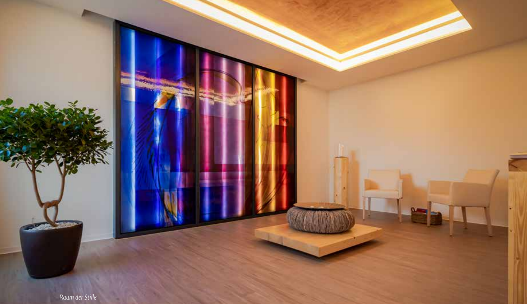
Raum der Stille

den Stein mit nach Hause nehmen. Er kann aber auch in den Garten zu den anderen Steinen gelegt werden, damit die Erinnerung bleibt.