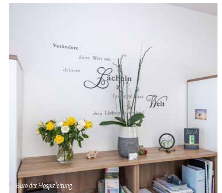
Büro der Hospizleitung