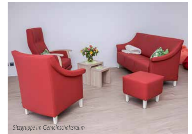
Sitzgruppe im Gemeinschaftsraum