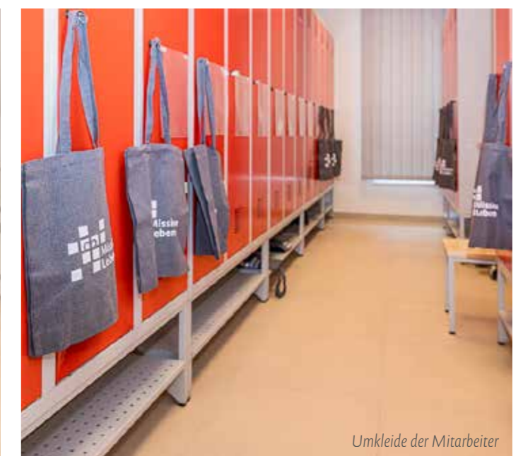
Umkleide der Mitarbeiter