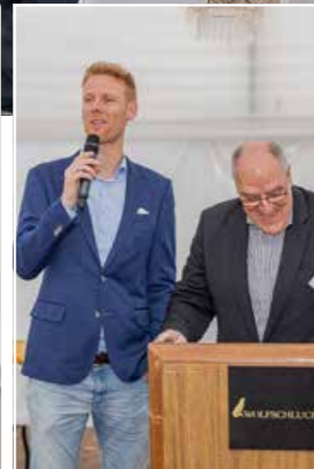
Jonas Reckermann, Olympiasieger und Vorsitzender der Werte-Stiftung