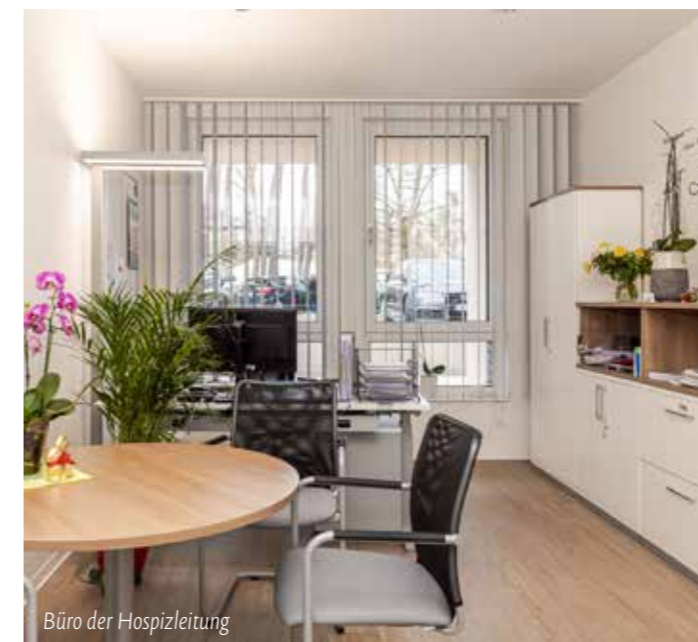
Büro der Hospizleitung