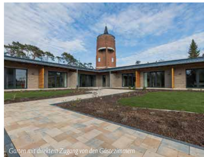
Garten mit direktem Zugang von den Gästezimmern

Die Zimmer der Gäste sind großzügig und in hellen Farben gestaltet. Große, bodentiefe Fenster sorgen für viel Licht und eine schöne Aussicht in die Natur. Die barrierefreien Räume haben jeweils ein eigenes Bad und einen eigenen Zugang in den weitläufigen Park, durch den sich ein Weg im asiatischen Muster schlängelt: vom Freisitz des Hospizes zum Grillplatz, vorbei an den Quellsteinen mit Wasserspielen. Sowohl die Betten als auch die Sessel lassen sich ganz einfach ins Freie rollen.