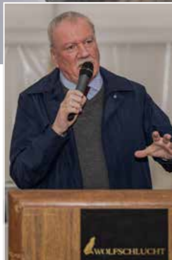
Frank Lortz, Vizepräsident des Hessischen Landtags